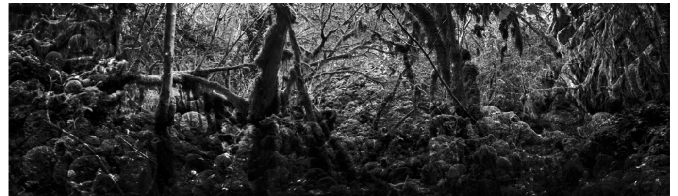
Igue de Pech Blanc (Étude) Tirage photographique impression pigmentaire Format variable, 2021