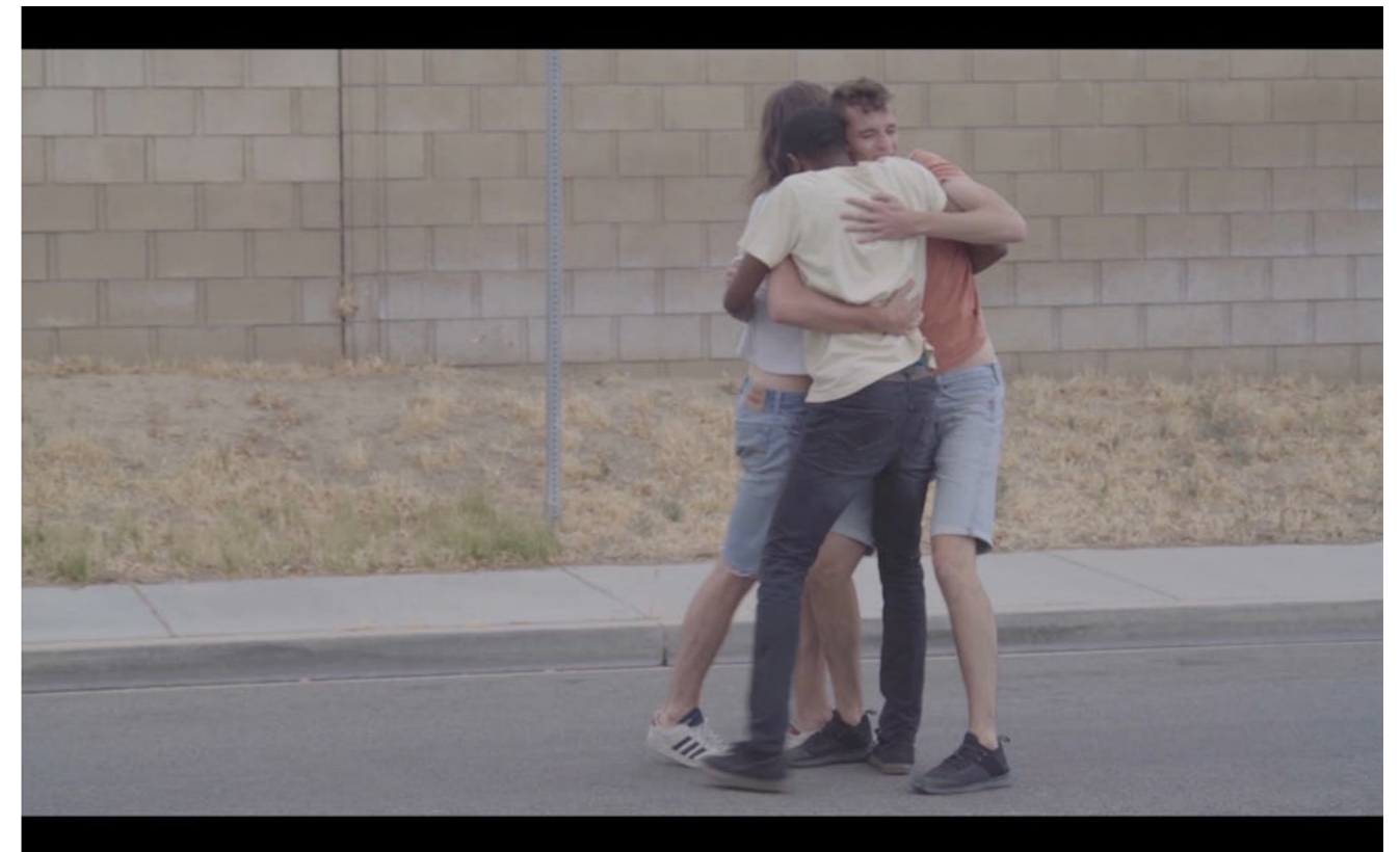
Les anges Vidéo HD, stéréo, 14 minutes, 2017 Vidéogramme © Lola González et la galerie Marcelle Alix, Paris