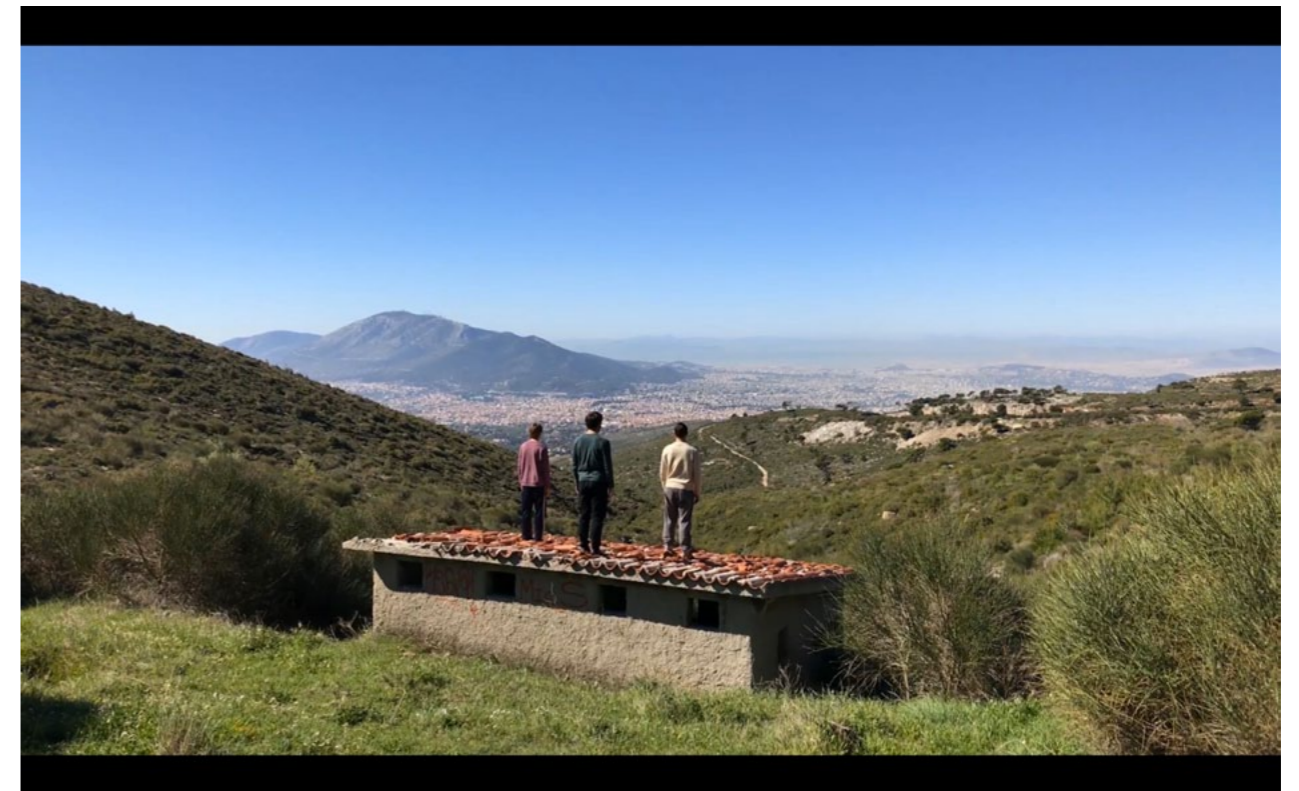
Now my hands are bleeding and my knees are raw Vidéo HD, stéréo, 7 minutes, 2017 Vidéogramme © Lola González et la galerie Marcelle Alix, Paris