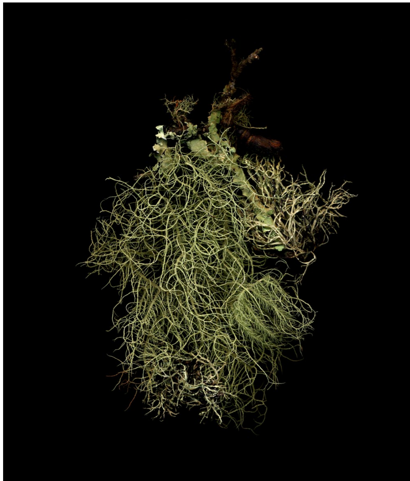
Lichen mixte Usnea (Lot) Série Bio Indicateurs Tirage photographique impression pigmentaire 80 x 120 cm, 2021