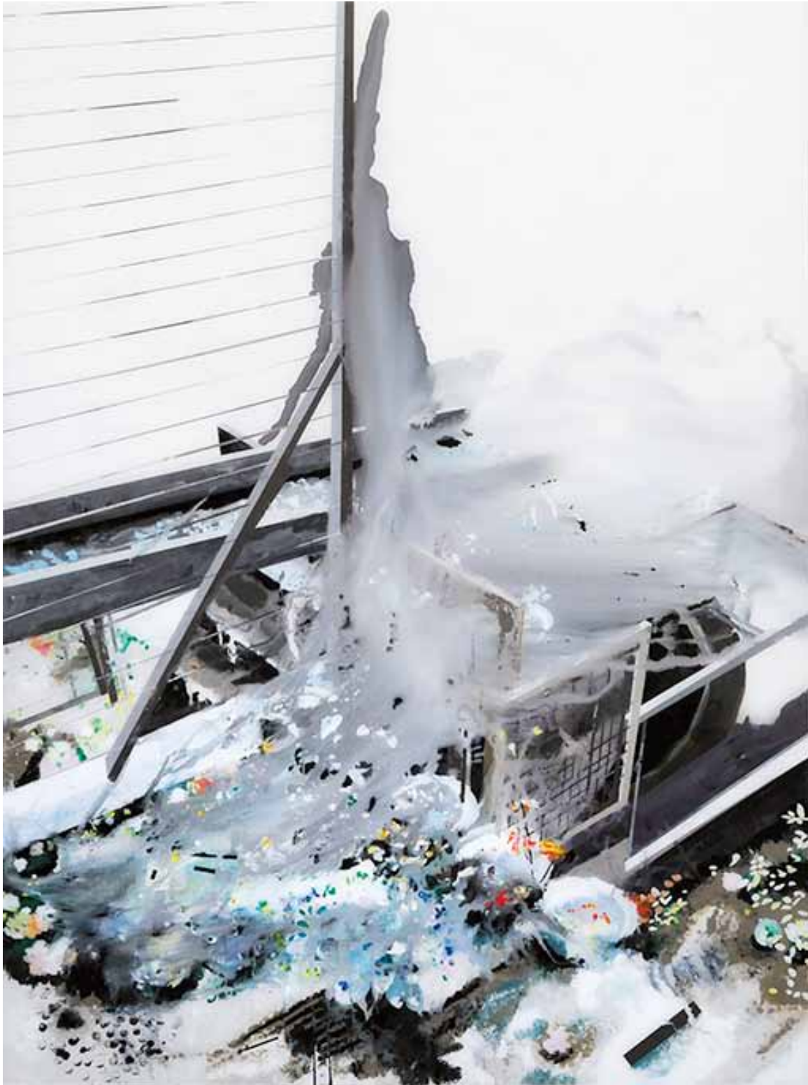
MURIEL RODOLOSE , La roue à eau , peinture sous Plexiglas, 135 x 100 cm, 2013