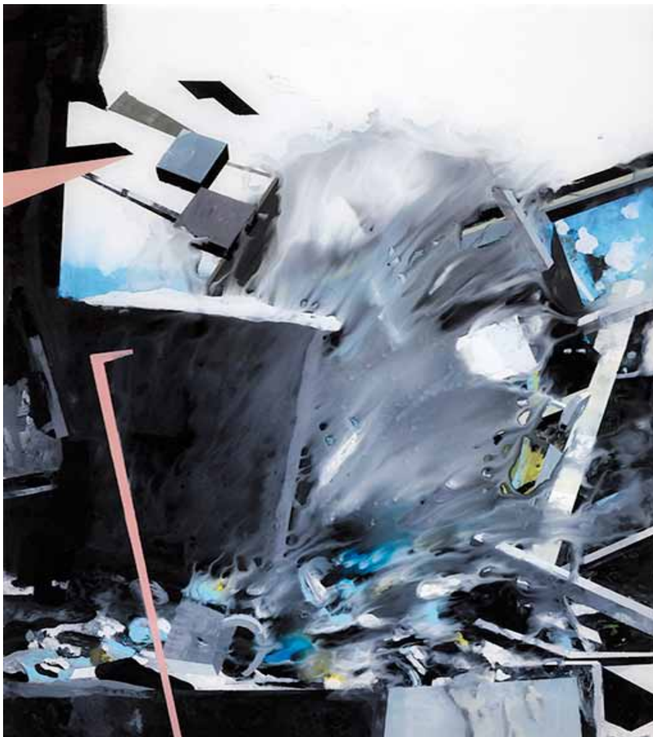
MURIEL RODOLOSE, La fuite d'eau , peinture sous Plexiglas, 60 x 47 cm, 2013