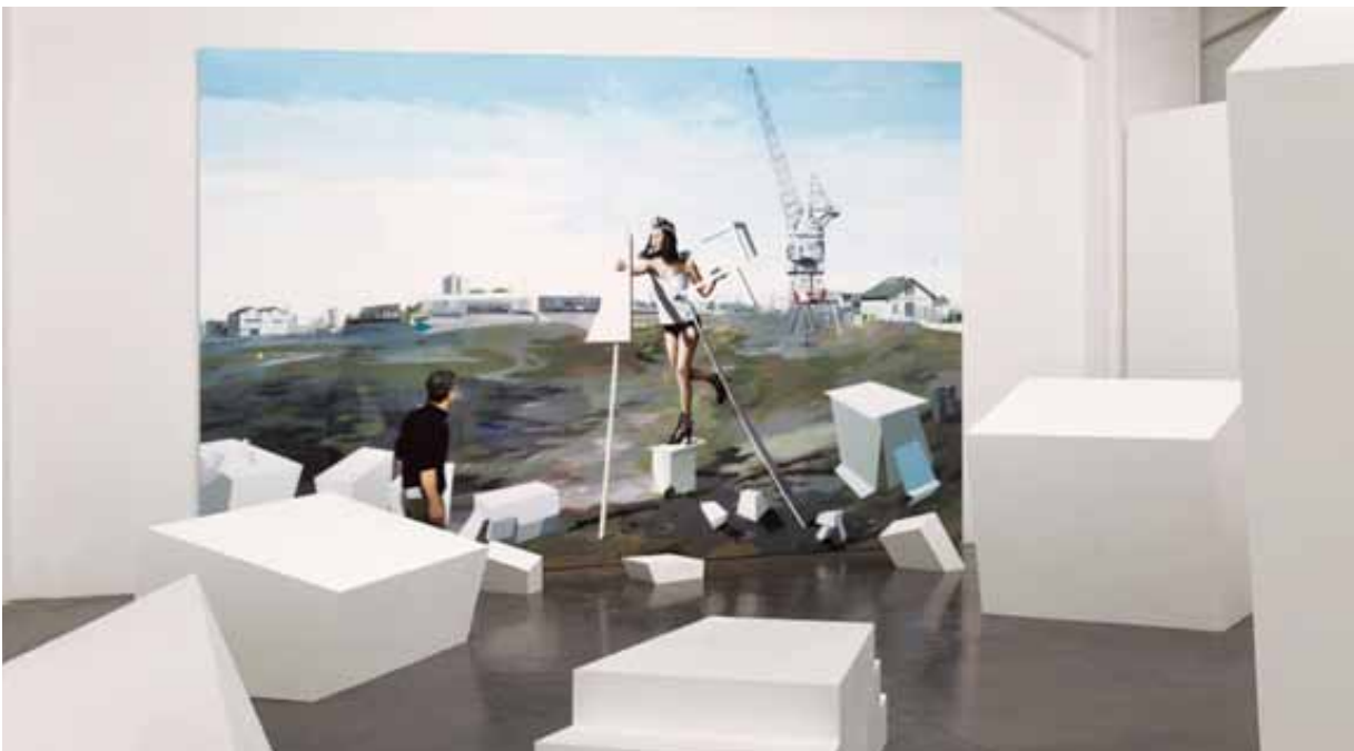
MURIEL RODOLOSE , Vue de l'exposition x degrés de déplacement au Frac Aquitaine, Bordeaux, 2011

Cet espace resserré, qui sert de passage entre les deux grandes salles, est complètement obstrué de volumes géométriques blancs de taille plutôt imposante. Ils rappellent la forme du socle ou suggèrent une parenté avec les cimaises du White Cube* , surfaces lisses et régulières, invariablement blanches. Les obstacles gênent la fluidité du trajet, contraignant le visiteur à enjamber, à contourner, pour aller au-delà de cette accumulation de volumes.