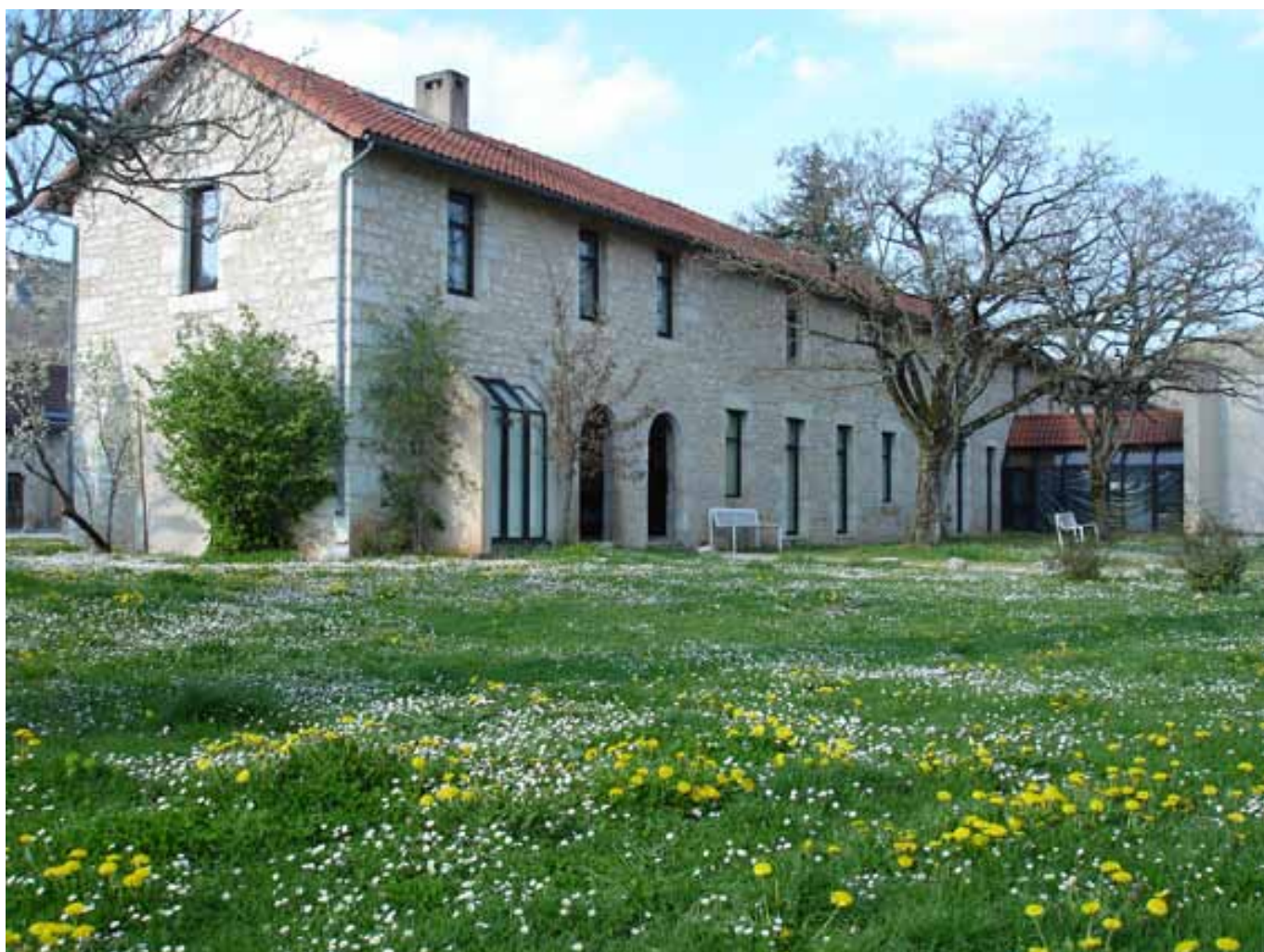
Vue du centre d'art contemporain à Cajarc.