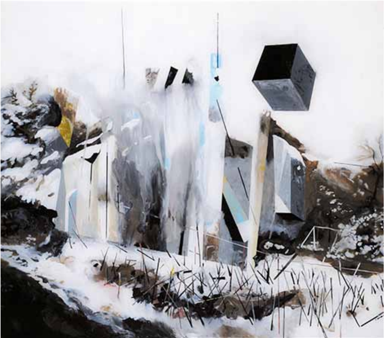
MURIEL RODOLOSE , La chute , peinture sous Plexiglas, 66 x 75 cm. 2013. courtesy de l'artiste