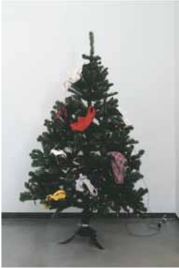
Paul-Armand GETTE Né en 1927 à Lyon. Vit à Paris

Merry Christmas, autre titre : Les étrennes d'Artémis, 1992 Collection FRAC Midi-Pyrénées, les Abattoirs