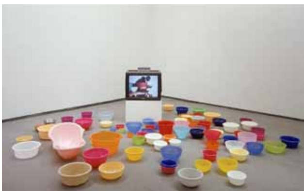
Fabrice HYBER Né en 1961 à Luçon. Vit à Paris

POF n°73 : gigognes, 1997 Collection FRAC Midi-Pyrénées, les Abattoirs