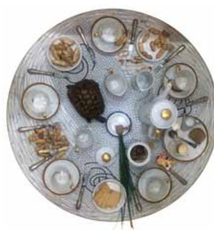
Daniel SPOERRI Né en 1930 en Roumanie. Vit en Autriche.

Avec ce Prototype d'Objet en Fonctionnement, le visiteur est invité à empiler bassines, bols et récipients. Il leur attribue de nouveaux usages et s'extrait de sa condition de regardeur pour devenir acteur de l'œuvre. Cette installation ludique interroge nos habitudes ménagères et met en perspective notre rapport à la télévision, tout aussi bien vecteur de divertissement, voire d'abrutissement, que formidable outil d'apprentissage, fenêtre ouverte sur le monde.