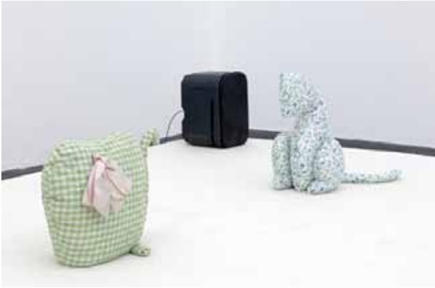
Mike KELLEY Né en 1954, mort en 2012 aux Etats-Unis

Dialogue #1 , 1991 Collection FRAC Languedoc-Roussillon