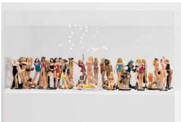
Milo MANARA Né en 1945, vit en Italie

Figurines MANARA, édition Atlas Collection Hervé DI ROSA