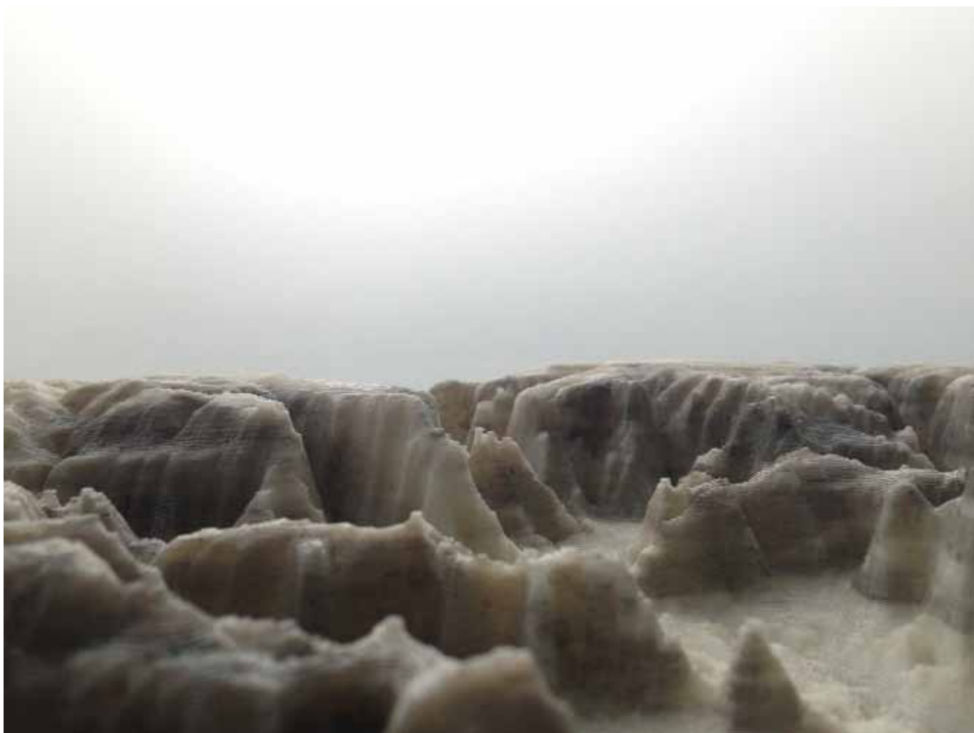
Eolorium Marie-Luce Nadal Installation 2013