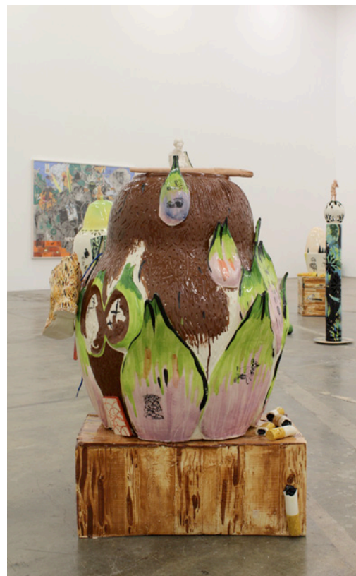
Série de vases céramique Formats divers 2015 - 2016