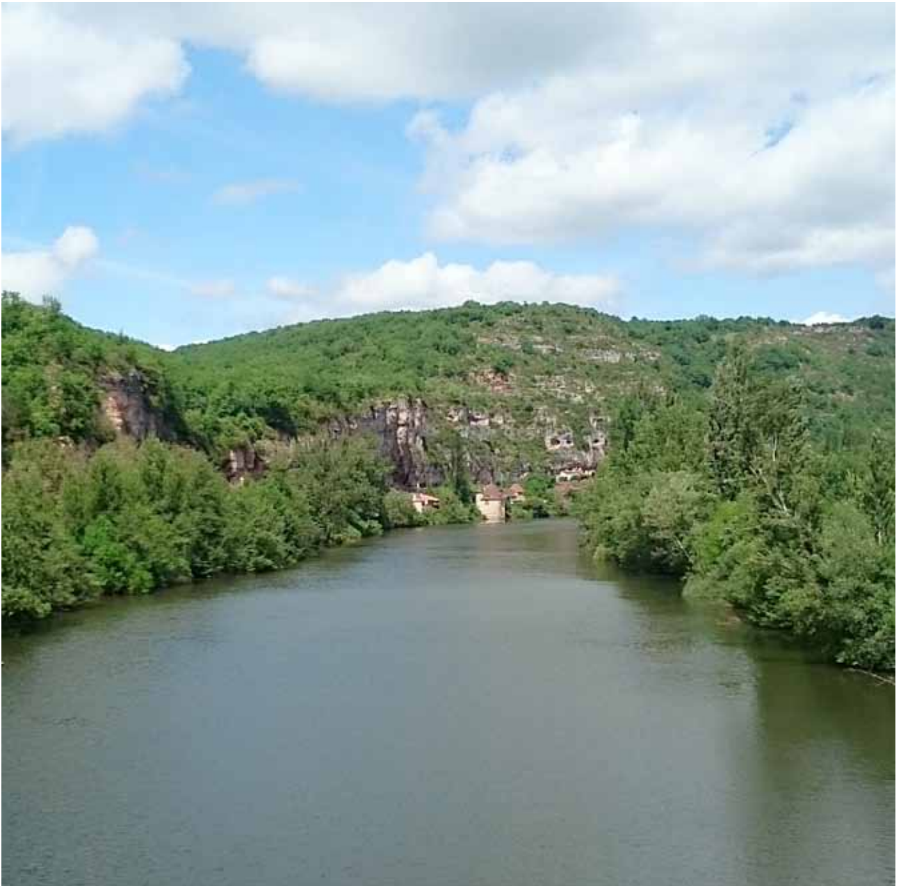
La vallée de Lot