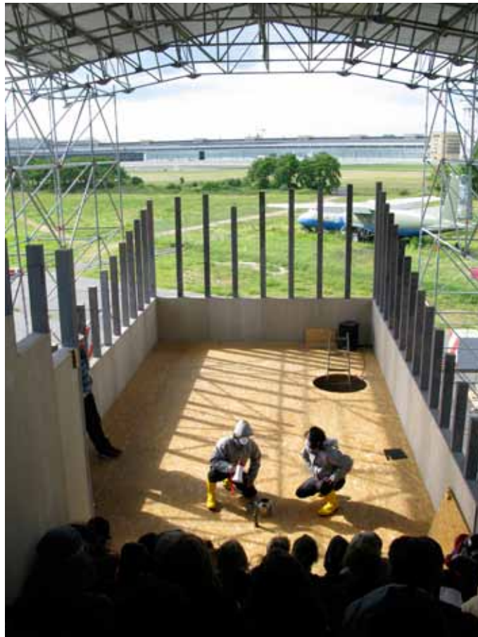
Raumlaborberlin The Great Worlds Fair 2012 Tempelhof, Berlin 2012