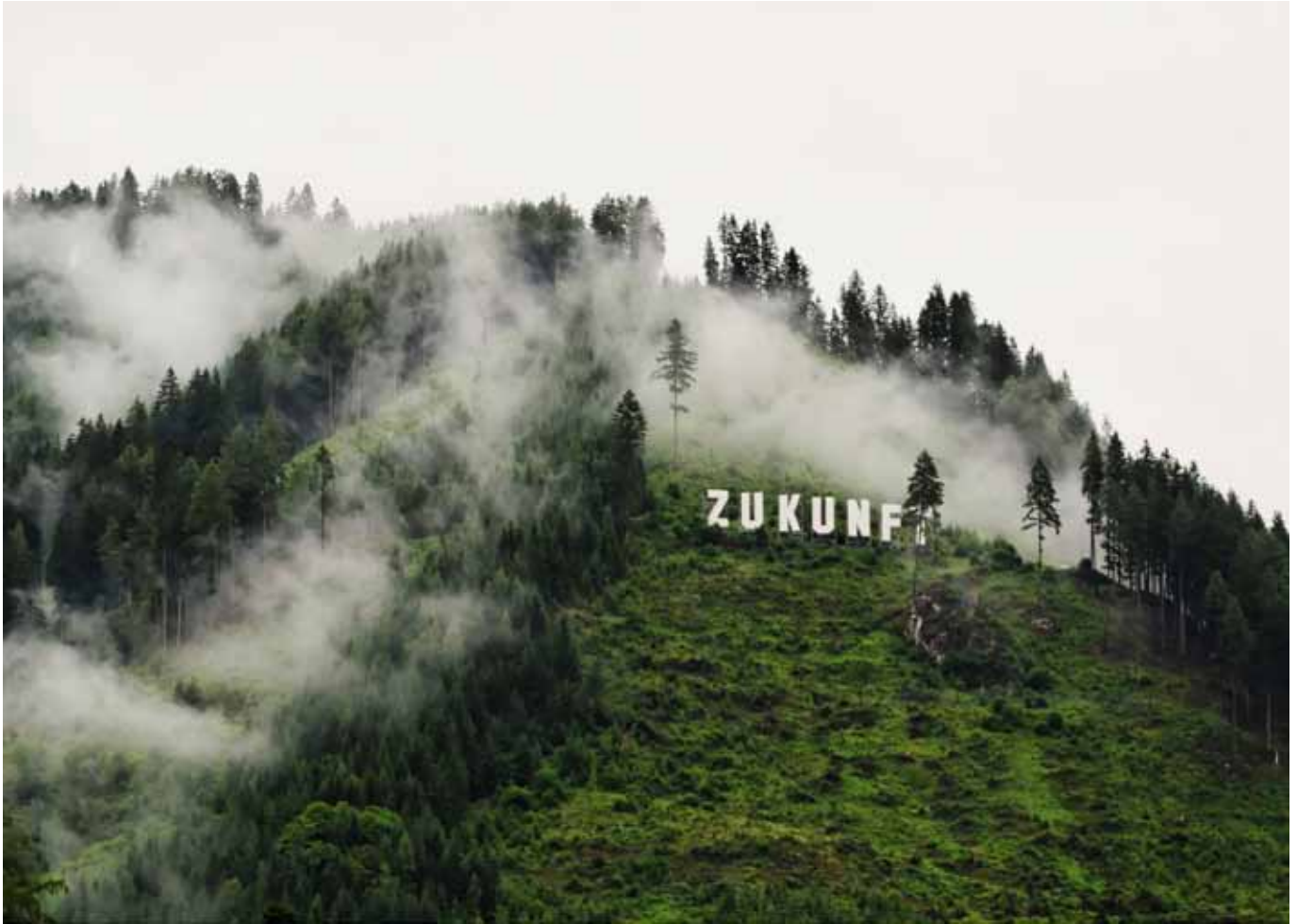
Raumlaborberlin Future One Murau, Austria 2012