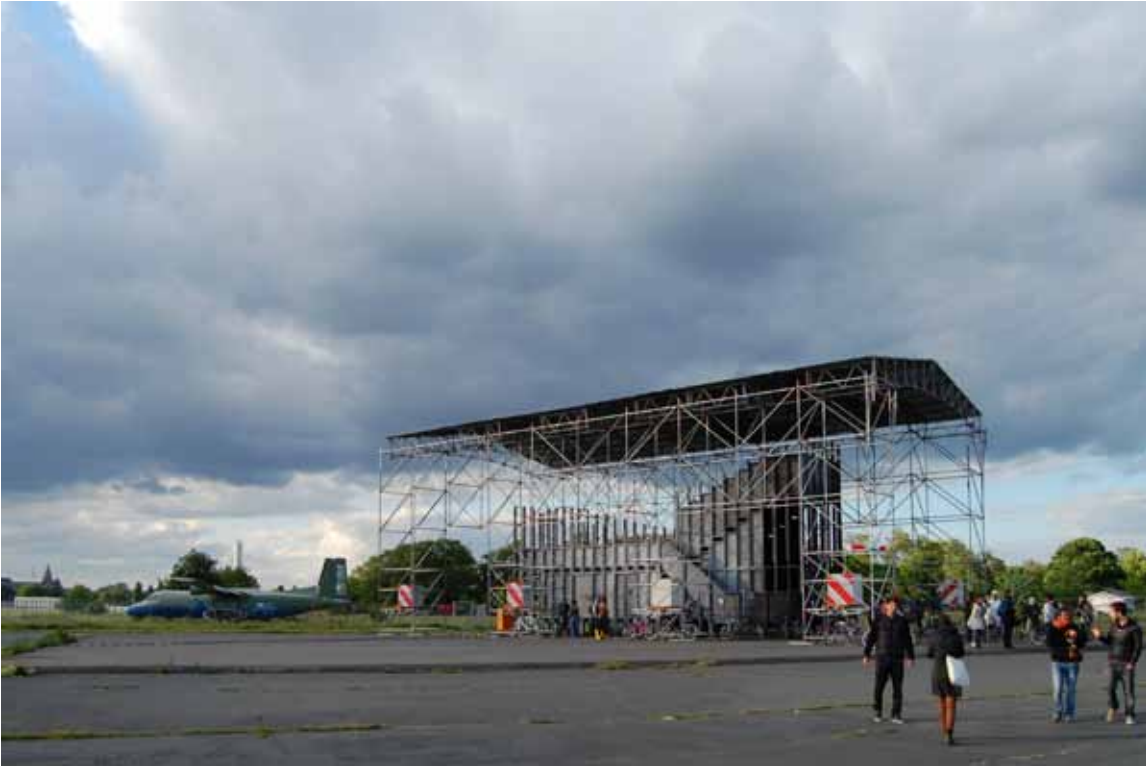
Raumlaborberlin The Great Worlds Fair 2012 Tempelhof, Berlin 2012