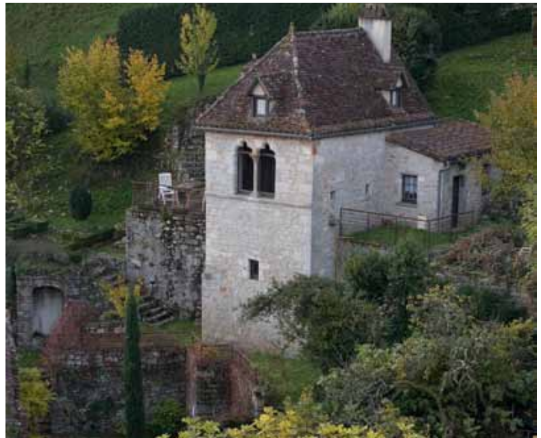
3 Atelier, Maisons Daura