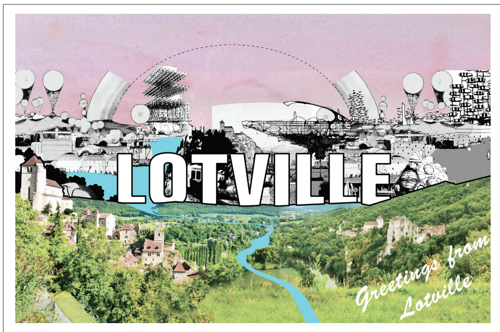
Raumlaborberlin, Greetings from Lotville , Photomontage, 10 x 15 cm, 2014

Lotville est l'expérimentation d'une ville utopique dans la vallée du Lot. Lotville prendra toute sa dimension de juillet à septembre, lors du 10 e Parcours d'art contemporain en vallée du Lot. Raumlaborberlin rendra visible, à l'aide de plans, de maquettes et de constructions à échelle 1:1, la structure de la ville fictive entre Cajarc et Saint-Cirq Lapopie.