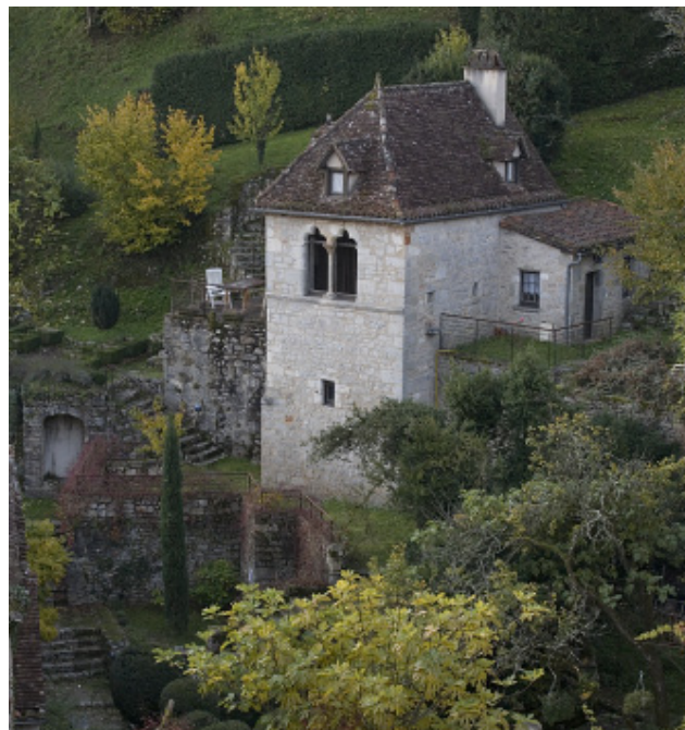
Les Maisons Daura, vue extérieure de la petite maison.

Nicolas Rivard (Québec, 1985). Ses performances, installations et pratiques infiltrantes questionnent les relations de l'art dans l'espace public.