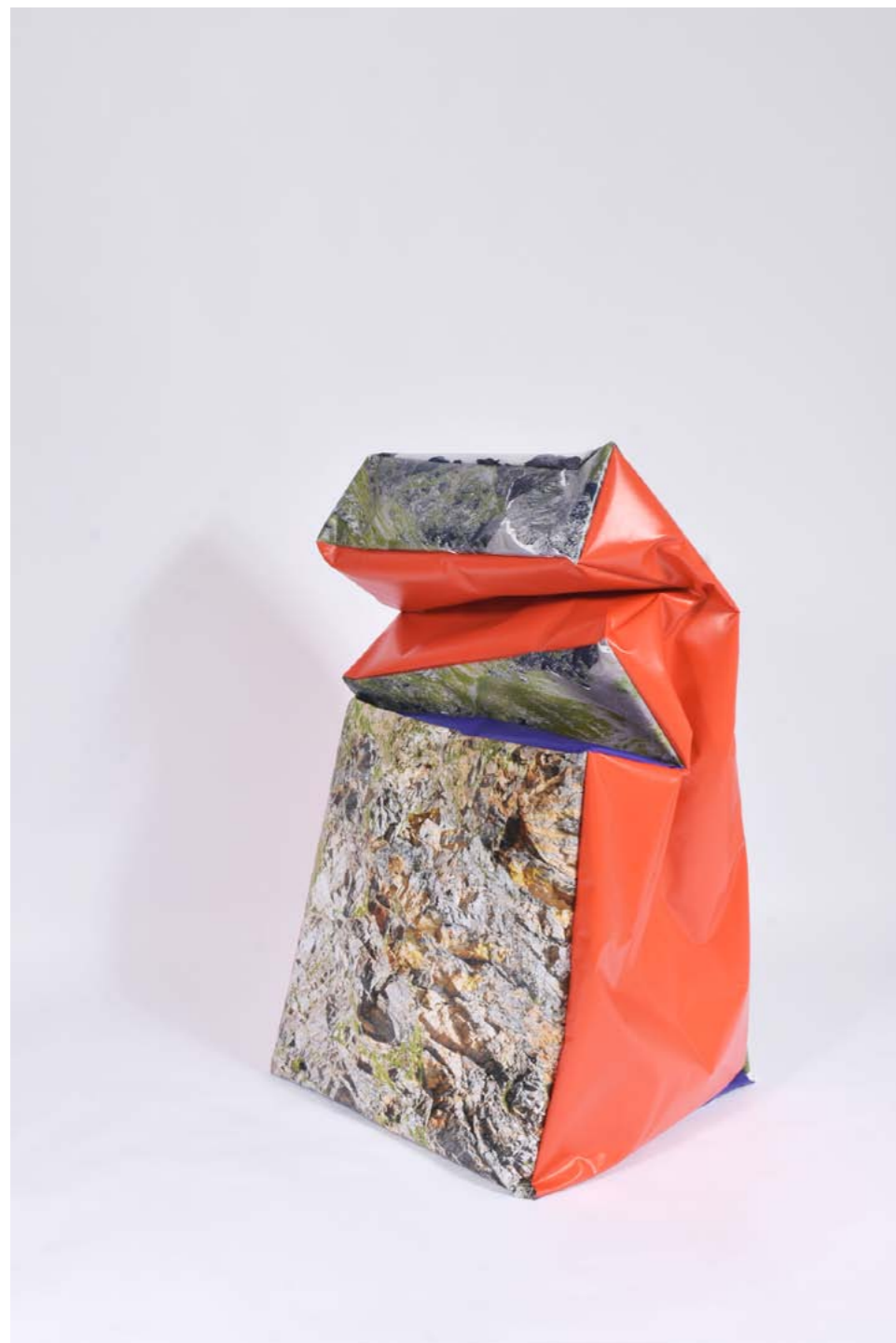
Morgane Denzler Soft . Sculpture, Module 4 Étude de paysage Sculpture, impression sur bâche 510 g 120 x 65 x 60 cm, 2019

NÉE EN 1986 À MAISONS LAFFITTE VIT ET TRAVAILLE ENTRE PARIS ET BRUXELLES