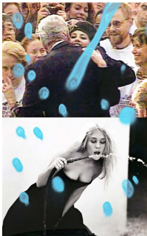
Mazzaccio & Drowilal Bill, Monica and Chloé de la série Iconology , bombe de peinture et adhésif sur tirage chromogène contrecollé sur porte isoplane, 100 x 62,5 x 4 cm 2018