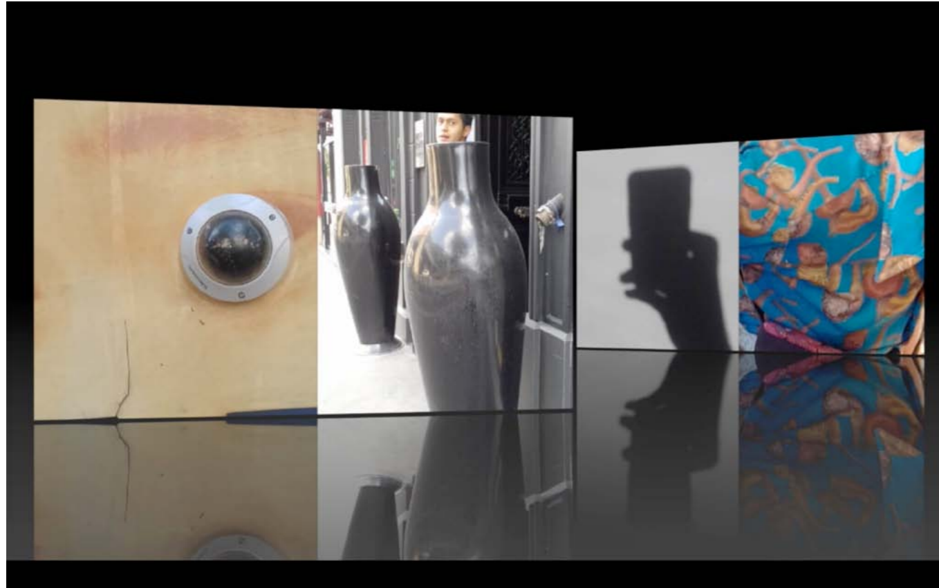
Pablo Réol Octave Vidéo (Capture d'écran), 2 min 2018

NÉ EN 1989 À BORDEAUX, VIT ET TRAVAILLE À PARIS