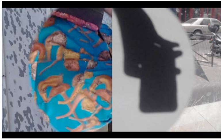
Pablo Réol Octave Vidéo (capture d'écran), 2 min 2018