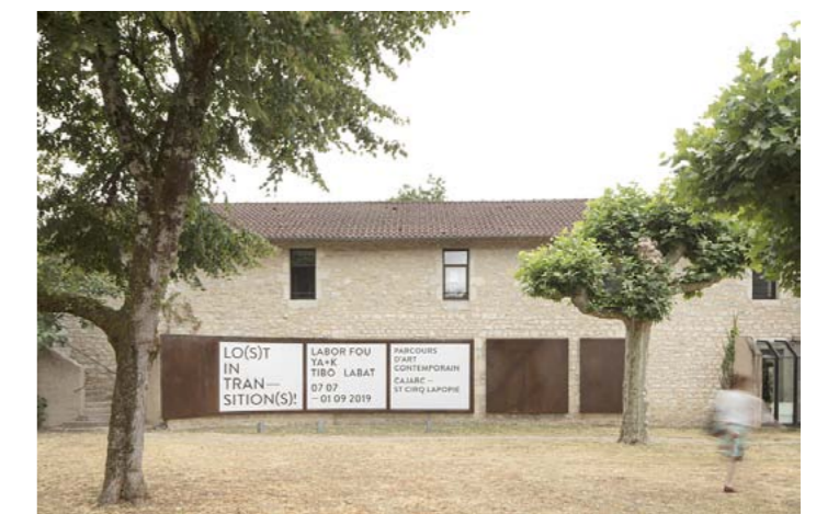
Façade de la MAGCP centre d'art, Cajarc 2019