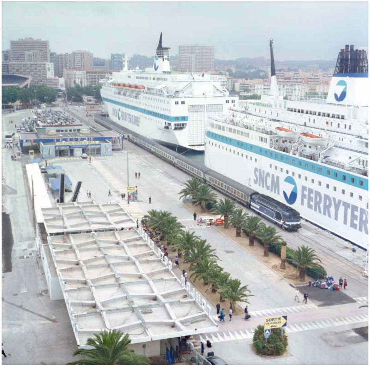
Mathieu Provansal, Toulon , juillet 1996. Photographie 40 x 40 cm