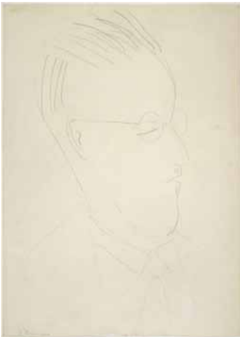
Constantin Brancusi (1876 - 1957), Portrait de James Joyce , 1929. Mine graphite sur papier, 42 x 32 cm.

Constantin Brancusi est une figure majeure de l'art au vingtième siècle. Il a pratiqué la sculpture, le dessin et la photographie, jouant de la matière, de la sérialité et de la mise en espace.