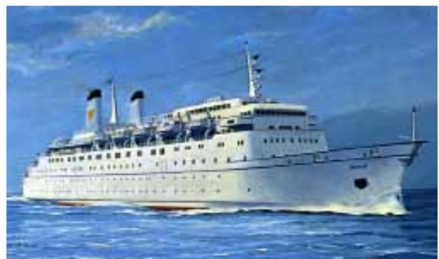
b) Le bateau de croisière