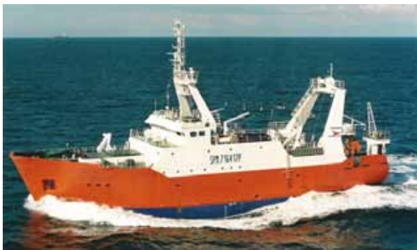
a) Le chalutier

Entoure le bateau qui correspond à la sculpture présentée dans l'exposition.