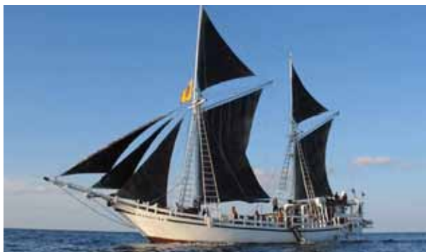
c) Le voilier

RÉPONSE : b) Le bateau de croisière. Celui-ci s'appelle Eagle, ce qui veut dire "aigle" en Anglais.